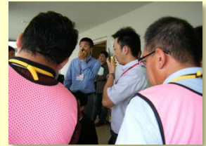
次々と被災状況が入電