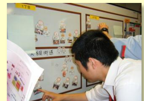
病院の受け入れ訓練