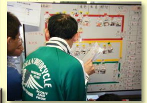
病院の受け入れ訓練