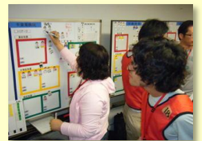
病院の受け入れ訓練