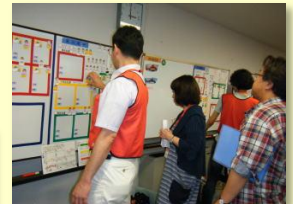
病院の受け入れ訓練